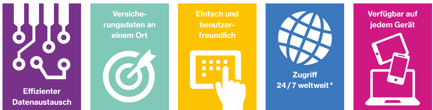
Abb. 3: Die digitale Versicherungsakte

*Vorbehaltlich geplanter Wartung und / oder Ausfälle