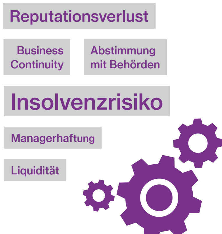
Abb. 2: Kritische Elemente von Großschäden

Bei Großschäden stehen viele Themen gleichzeitig auf der Agenda. Wir kümmern uns um jedes einzelne.